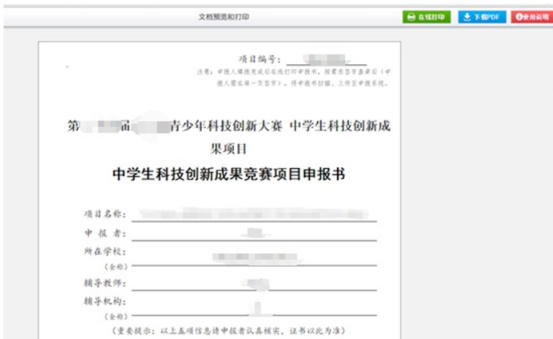
图 6-3 打印页面

第三步，上传提交：点击“点击上传”按钮将签字、盖章的申报表电子版上传；请务必上传系统自动生成的申报书；附件大小<1MB；允许格式为 JPG。