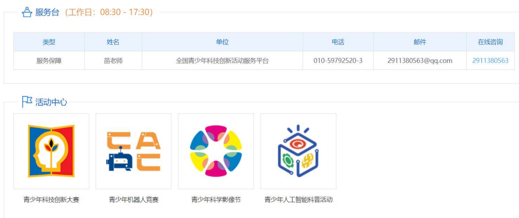
图 1-2 选择活动类型