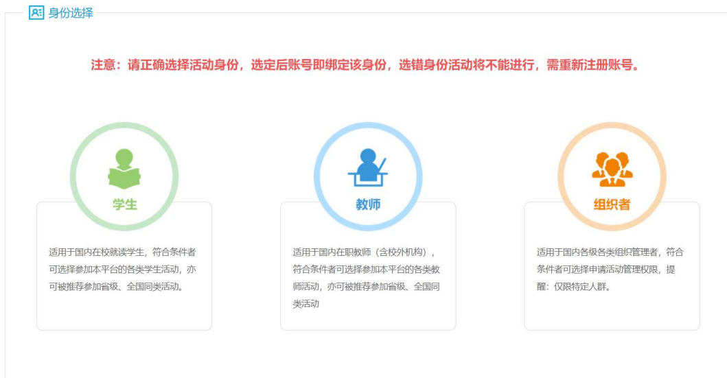
图 1-1 身份选择

第一步，“身份选择”下选择“学生”或“教师”；已进行身份选择的用户无需再次选择，直接参与申报即可。