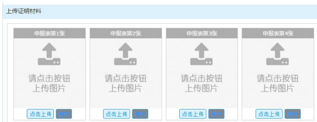
图 6-4 上传证明

第三步，上传提交：点击“点击上传”按钮将签字、盖章的申报表电子版上传；请务必上传系统自动生成的申报书；附件大小<1MB；允许格式为 JPG。