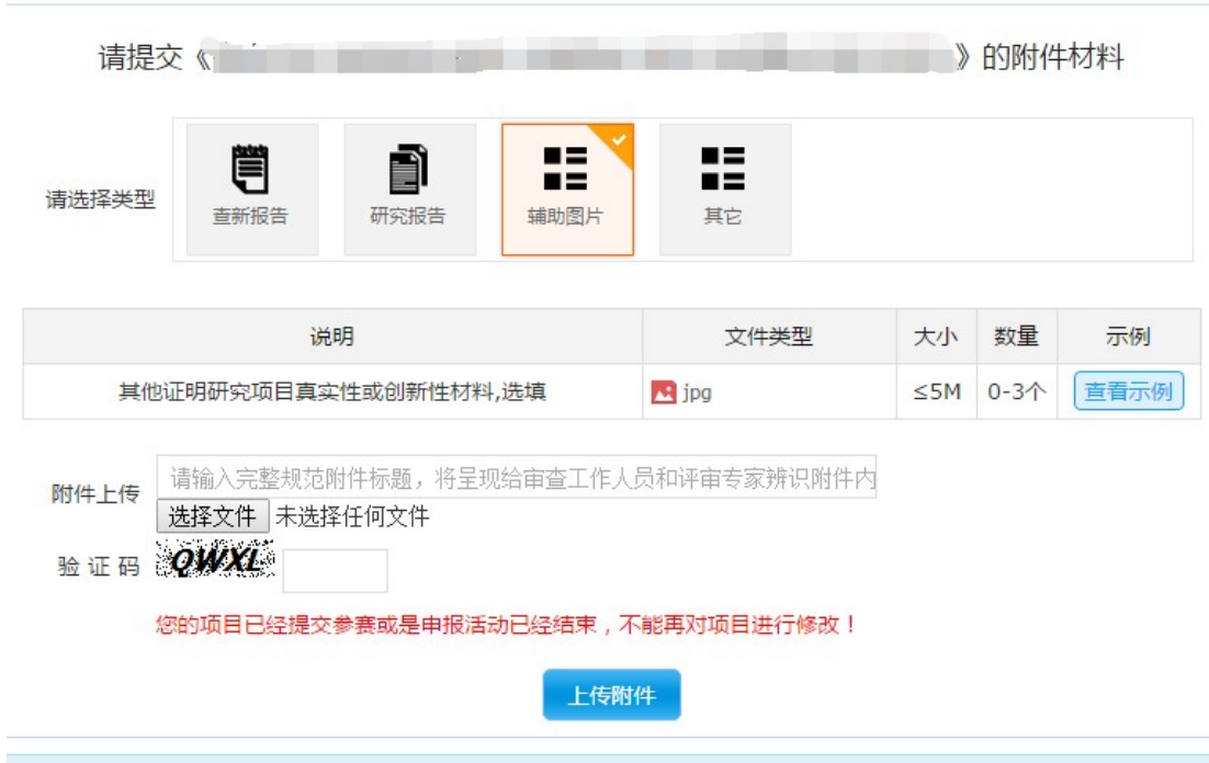
图 5-2 上传附件

第二步，选择附件类型、填写附件名称、选择附件文件、填写验证码，点击“上传附件”按钮。